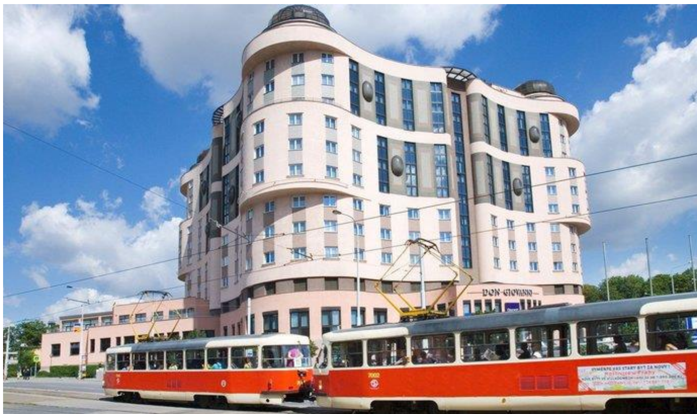
Hotel Don Giovanni

Městský poplatek 21 Kč (cca 0,8 euro) za osobu a den hradí účastníci přímo v hotelu při příjezdu Parkování v podzemních garážích hotelu Don Giovanni pro účastníky MS za speciální cenu 250 Kč/den