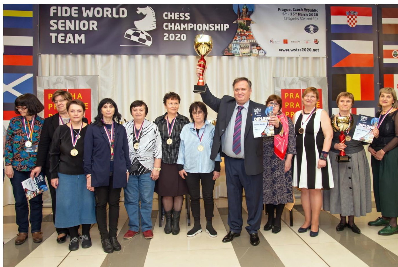
Vítězové ženské kategorie nad 50 let na loňském Mistrovství světa pořádaném v Praze

Vítězné družstvo žen Mistrovství Evropy seniorů v kategorii žen +65 obdrží titul "Mistr Evropy družstev seniorů v kategorii ženy +65 pro rok 2021".