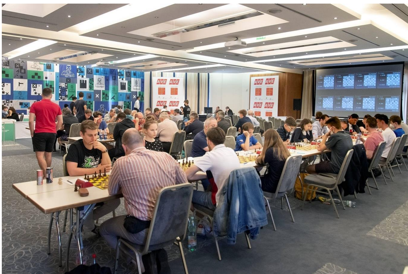
Hrací sály hotelu Don Giovanni